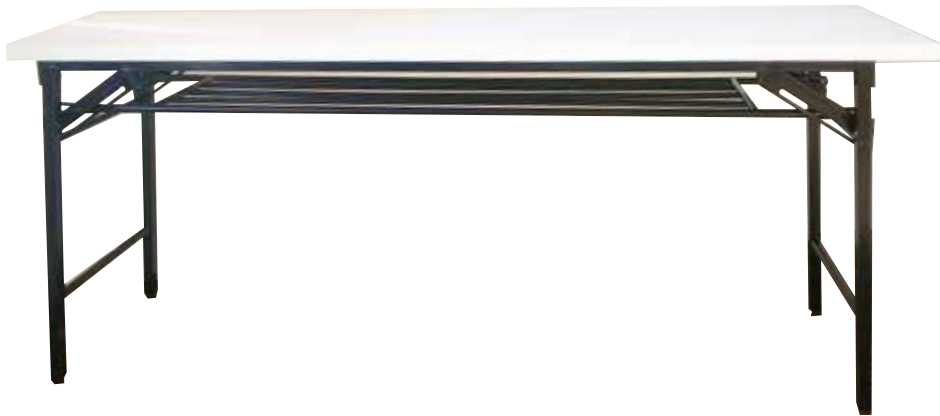
折りたたみ 会議テーブル・・・4台 (幅 1,800mm × 奥行き 455mm)