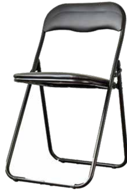
折りたたみ椅子・・・20脚